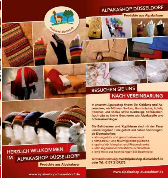
Abbildung 2: Flyer Shop